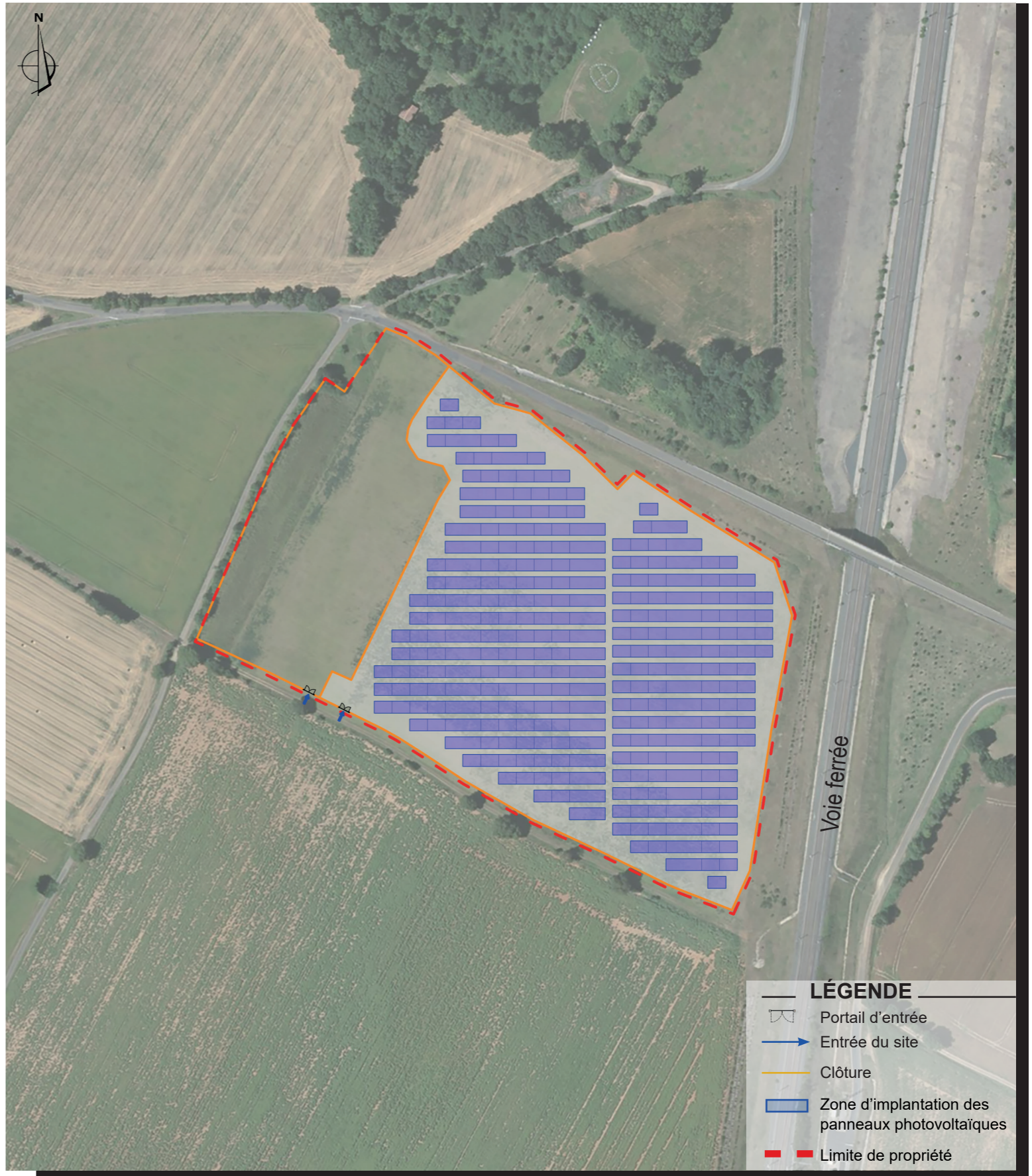
Aérienne - google earth - Echelle : 1/3000ème